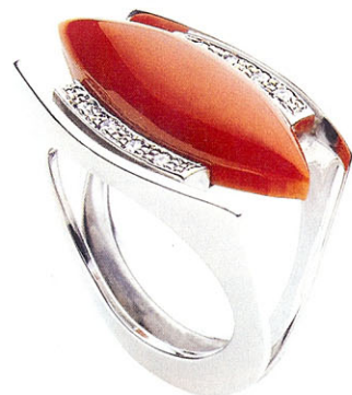
A DESTRA: anello di Ascione. Corallo mediterraneo, oro e brillanti. 1.750 euro.

Sempre più difficile la vita nei mari di tutto il mondo, eppure il corallo continua a prosperare. Grandi griffe di caratura internazionale, come Tiffany, hanno da tempo rinunciato a farne uso nei loro gioielli, ricorrendo a smalti o pigmenti che ne imitano lo splendore. Altre, conscie del fascino estetico e simbolico di questa "gemma" di origine organica (è infatti frutto delle secrezioni calcaree dei polpi che abitano i mari a decine di metri di profondità), lo utilizzano con misura, orchestrando tavolozze preziose di grande suggestione cromatica.